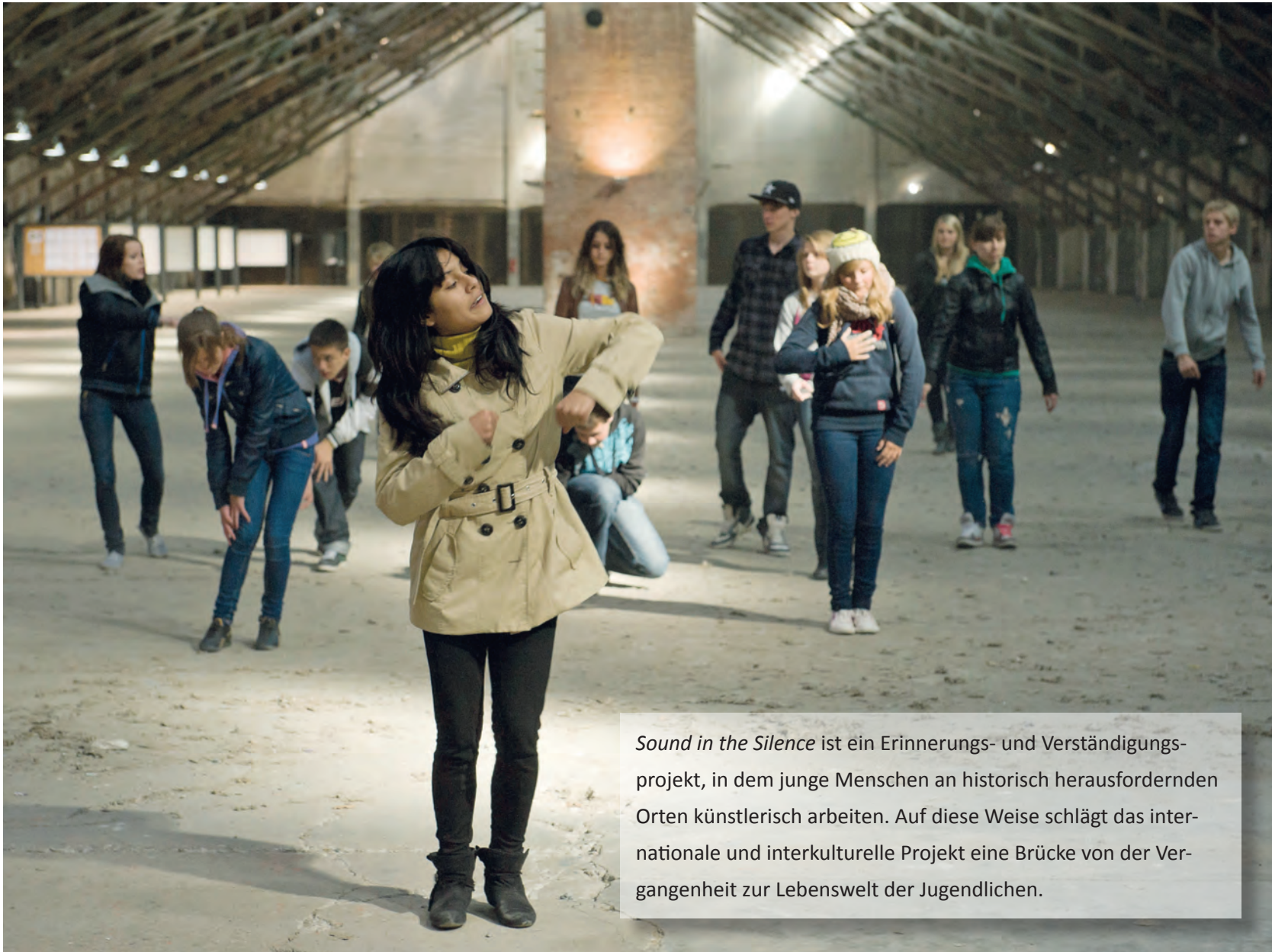
Sound in the Silence ist ein Erinnerungs- und Verständigungsprojekt, in dem junge Menschen an historisch herausfordernden Orten künstlerisch arbeiten. Auf diese Weise schlägt das internationale und interkulturelle Projekt eine Brücke von der Vergangenheit zur Lebenswelt der Jugendlichen.